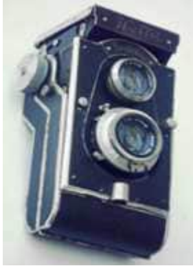
Welta- Perfekta - 2

alors vieillir doucement sans trop de marques d'usage et attendre qu'un collectionneur le sorte de l'oubli.