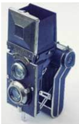
Welta- Perfekta 1

L'arrivée du Rolleiflex en 1929 a incité plusieurs producteurs allemands à tenter de se faire une place sur cette nouvelle niche très prometteuse des 6x6 bi-objectifs. L'un des premiers à tenter l'aventure fut Welta, une société installée à Freital près de Dresde depuis 1920, réputée pour la qualité de ses appareils. Mais comment prendre pied rapidement sur ce marché sans se faire accuser de plagiat par Francke & Heidecke ?