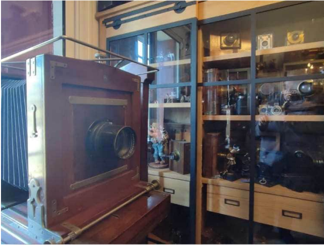
Une des deux chambres d'atelier

à son nom illustrant les courses de taureaux. Normal, Nîmes est aussi la Mecque des aficionados !