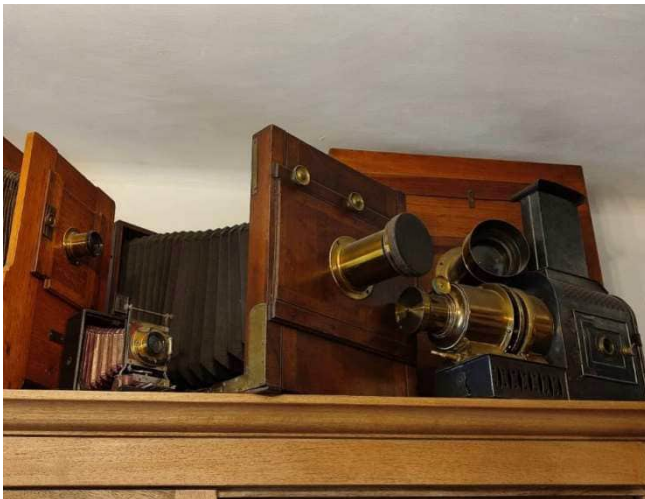
Quand il n'y a plus de place sur les étagères...