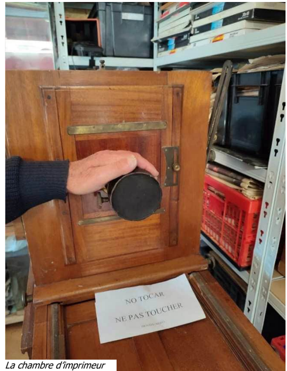
La chambre d'imprimeur