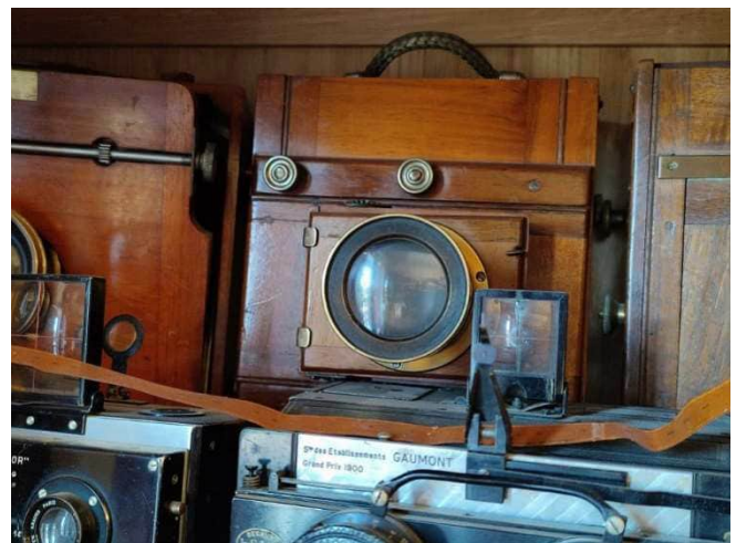
La première chambre, début de la collection

Un regard plus poussé sur la chambre à tiroir et je découvre une optique Lerebours et Secrétan. Mazette ! Deux autres chambres à tiroir secondent