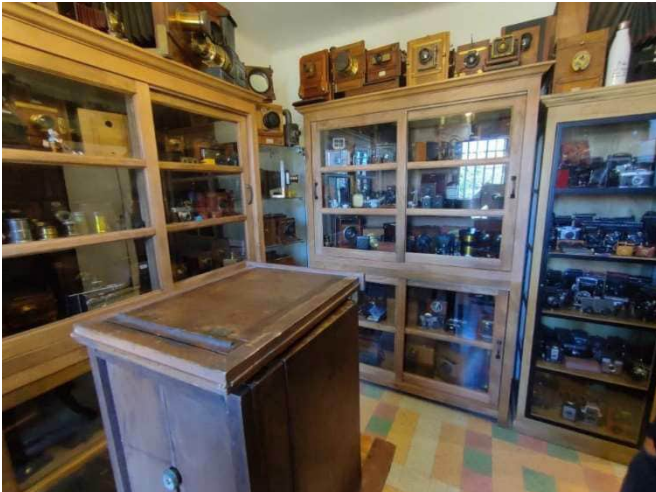
Deux murs avec ses vitrines